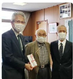
内田校長へ寄付金のお届け