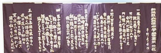
三条高校学校 懐かしい校歌(1番～5番)