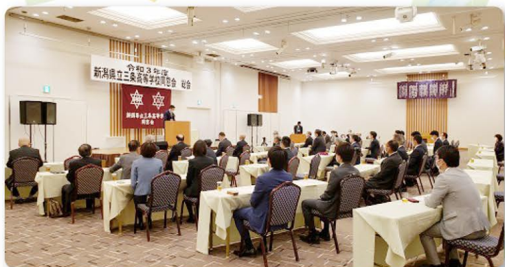
初のリモート併用での総会開催 参加者50名