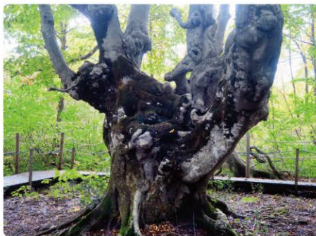
樹齢300年、森の王様『あがりこ大王』

のために伐採した枝が、芽を出し成長を続けたことが、この独特な樹形の理由だといわれています。とにかく異形ブナ林の豊富なところで一日歩いても飽きないところですよ。途中湧き水の豊富なところ、おいしい湧き水を飲みながら昼食をとりました。後は今夜の宿、酒田市、湯の台温泉 鳥海山荘のお楽しみ。