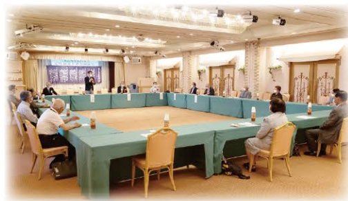
コロナ感染対策されスペース十分な会場