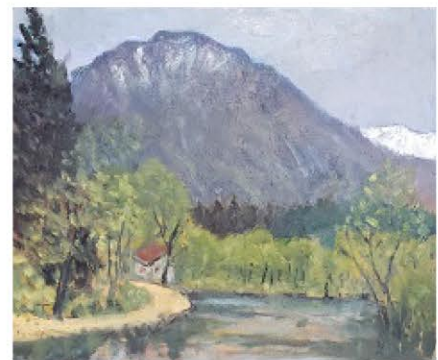
『黒姫山といもり池』