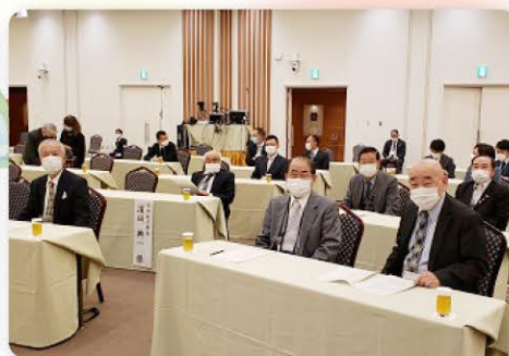
定時制部会 参加者5名