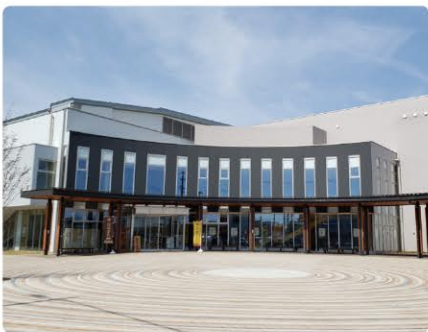
三条市体育文化会館

中学を卒業したとはいえ、まだ子供なのに、次の日から、昼仕事、夜学校と遊ぶ暇もない世界に入り月末にお給料も貰えませんでした。住込で六千円頂き、三千円が食費で天引きされて後の三千円は、学費千五百円、残は手元金と経済が身に付きました。夜の学校は、一時間目の授業は大抵寝ましたが、給食の時間後はしっかりと勉強し、環境に慣れ少し大人に成った頃には四年が過ぎ再び進路の選択に迷うことなく同じ道を選びました。上京後は昼夜同じでも内容が少し大変でした。でも、定時制時代の基盤が身に付き臆することなく無事終了。そして今は良き思い出です。