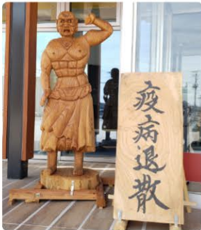
三条市体育文化会館 玄関

コロナ禍の中、同窓生の皆さんは、どのように過ごしていますか。今は外出を自粛し、辛抱強く新型コロナウイルスの収束を待つしかありません。身体への免疫力を高め、体力をつけ、この難局を乗り切りましょう。