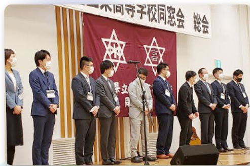
総会 準備役員 ありがとう第53回・第54回卒業生