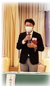
野水同窓会長 ごあいさつ

次年度は盛大に開催したいと思います。 令和4年6月11日土曜日 第22回総会・懇親会を予定しています。